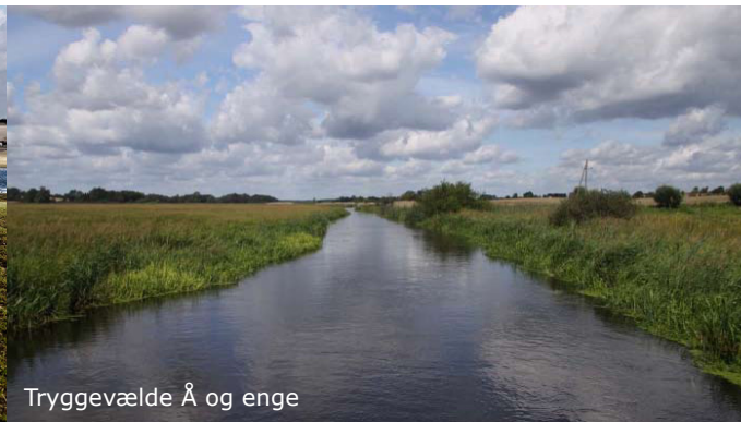
Tryggevælde Å og enge