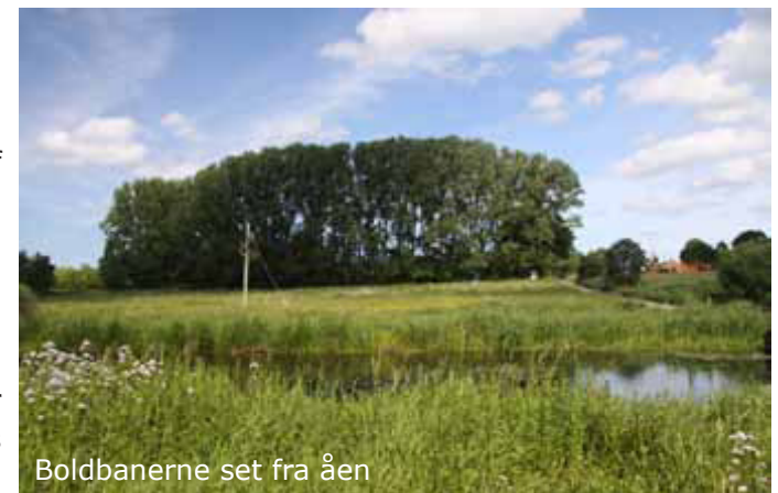
Boldbanerne set fra åen

Borgerforeningens formål med huset og udearealerne er, at give plads til lokale og besøgende med interesse i at opleve Tryggevælde ådals særlige historie, natur og landskab. Borgerhuset og tilhørende friarealer skal være et samlingspunkt for naturvejlederen, skoler og folk, som vil lære om stedet og som vil færdes i natur- og kulturlandskabet.