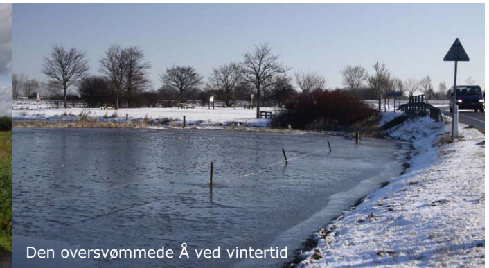
Den oversvømmede Å ved vintertid