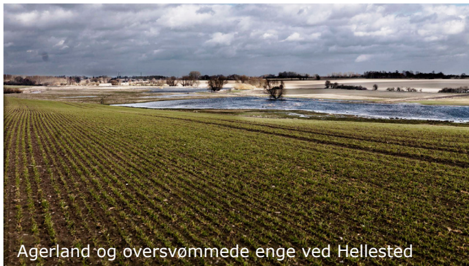
Agerland og oversvømmede enge ved Hellested

Byen Strøby er placeret højt i landskabet ved ådalens østlige side. Strøby ligger centralt i området, med direkte forbindelse til ådalens enge, et allerede etableret stisystem, fugletårn og shelter. Det grønne område der forbinder ådalen og byen ejes af Stevns Kommune, og ligger tæt på Strøby Kirke og det kommende Landskabsrum, som landsforeningen Martin A. Hansen planlægger at anlægge. Arealet i Strøby rummer således aktiviteter og faciliteter, der med stor fordel kan bygges videre på. Arbejdsgrupperne har peget på netop dette areal som oplagt for placeringen af Tryggevælde Huset.